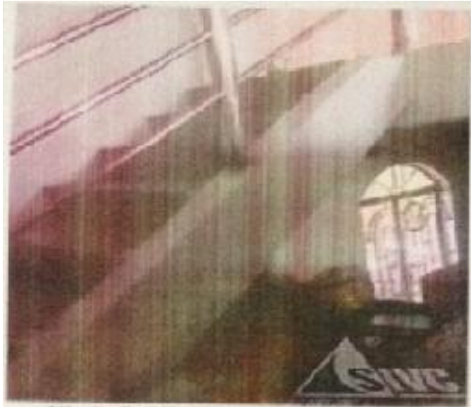
Hình 5: Hiện trạng tài sản TĐG.