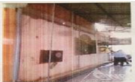
Hình 2: Hiện trạng tài sản TDG.