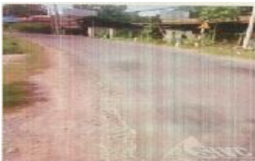
Hình 1: Đường hương lộ 24 (đường nhựa rộng 7m).